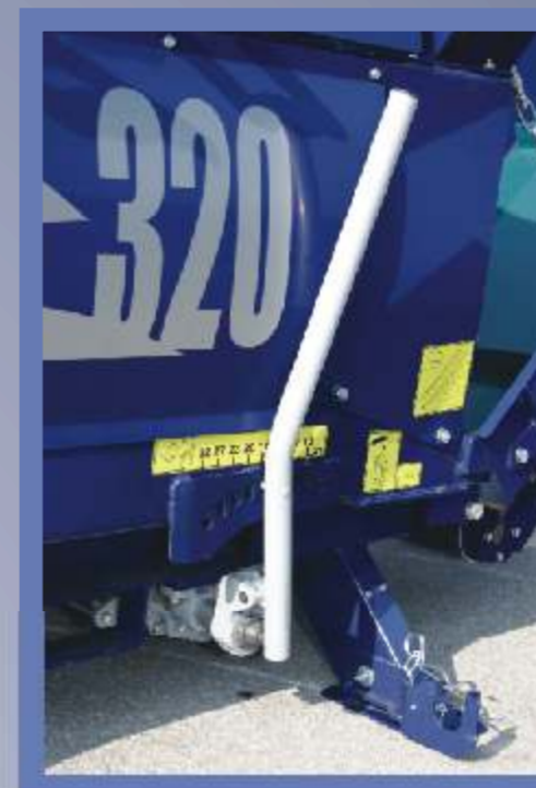
Pomoću ručice podešavamo visinu noža za cepanje prema debljini trupaca.