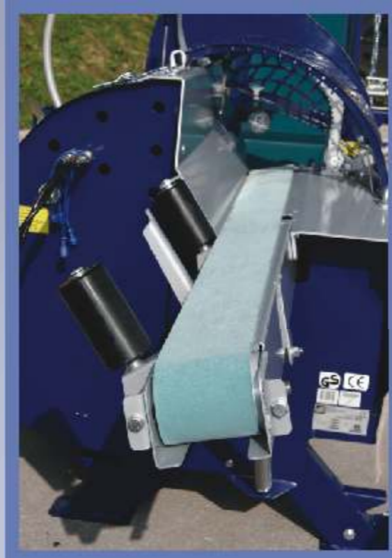
Sklopiva traka (2m) za privlačenje omogućuje takođe privlačenje i težih trupaca.

RCA 320-2 omogućuje rezanje trupaca promera od 10 do 32 cm i cepanje drva dužine od 25 do 50 cm . Sa stolom za dizanje DM 1501 trupac podižemo na radnu visinu, odakle ga pomoću transportne trake pomeramo do graničnika i onda režemo. Odrezani deo pada u korito za cepanje, gde ga hidraulični klip sa snagom do 100 kN (10 t) gura prema nožu. RCA 320-2 ima dva hidraulična klipa, svaki ima snagu cepanja do 10 t . Odrezani deo se pomoću noža za cepanje rascepi na dva i četiri (standard) ili šest delova (dodatna oprema). Podešavanje visine noža za cepanje vrlo je jednostavno (sa ručicom na spoljnjem delu mašine), isto tako i zamena noža koji se ručno vadi u roku od 2 do 3 minuta. Pomoću transportera dužine 4 m cepanice transportujemo na željeno mesto.