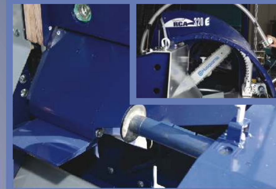
RCA 320-2 ima inovativan graničnik dužine, koji omogućava podešavanje dužine od 25 do 50 cm po 5 cm. Rezanje sa lančanom testerom je brzo i sigurno, a održavanje vrlo je jednostavno.