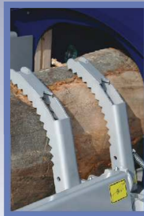
Sa potisnom ručicom fiksiramo trupac, čime ga osiguravamo od okretanja i prevrtanja.